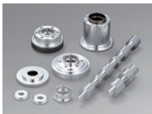
各種アルミ合金管・棒

アルミ合金は美しく、軽量で、耐食性、加工性にすぐれ、強度が高いなど数々のすぐれた化学的、物理的特性をそなえた材料です。 豊富な種類、質別により、用途に合わせて最適な合金が選定いただけます。 高野軽金は、管材、棒材をお客様ご要望の寸法にカットして納品致します。